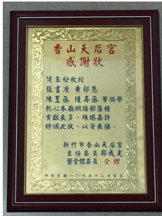
圖十八:香山天后宮感謝狀