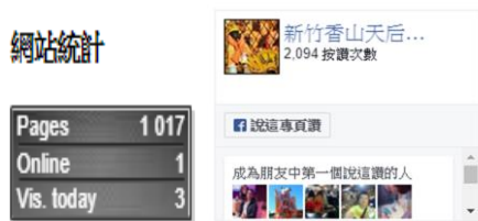
圖十五:流量計數器[8, 9]